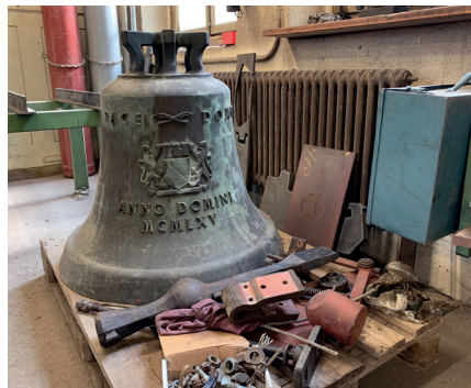
der Giesserei; vom Modell, bis zur fertig gegossenen Glocke.