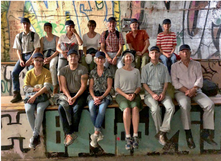
Die Teilnehmer der Herbstversammlung am Birsigkanal. (Bild: Markus Hodler)