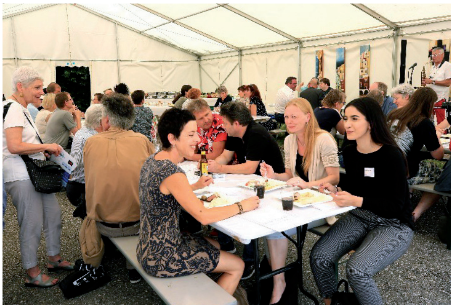
Den zahlreichen Gästen am Tag der offenen Tür wurde auch kulinarisch und musikalisch einiges geboten.

Kurzum, es war ein sehr gelungenes Jubiläumstfest mit traumhaftem Wetter, guter Stimmung und zahlreichen Besuchern! (pd)