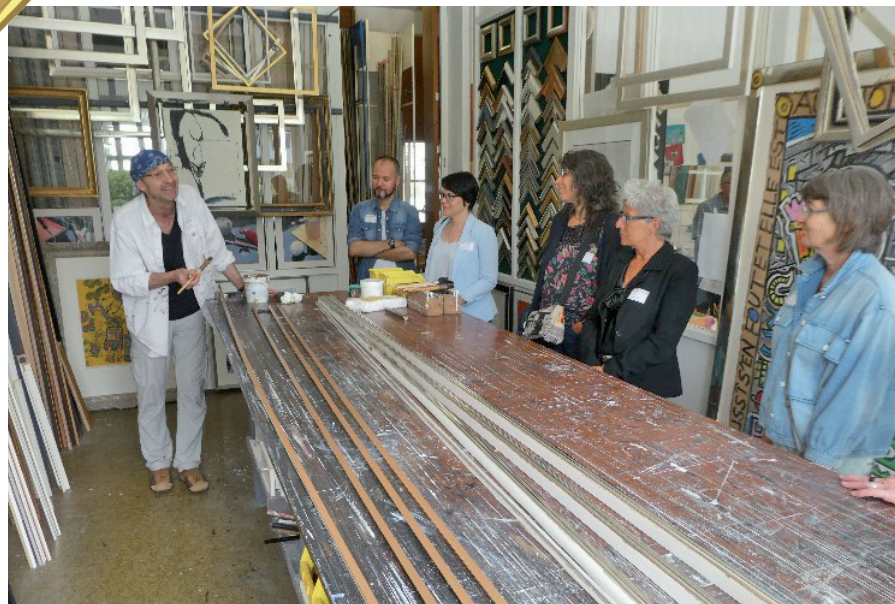
Der interessante Rundgang durch die verschiedenen Ateliers war einer der Höhepunkte am Tag der offenen Tür.

Am 8. Juni 2018 feierte die Firma A. Stadelmann AG mit ihren Mitarbeitenden an ihrem Firmensitz in Allschwil das 50-Jahr-Jubiläum mit einem Tag der offenen Tür. Die knapp 200 interessierten Fachleute und Besucher kamen aus der ganzen Schweiz und teilweise auch aus Frankreich und Deutschland.