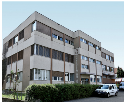
Das Firmengebäude der A. Stadelmann AG in Allschwil.

Die grosszügigen Räumlichkeiten mit den verschiedenen Ateliers, die verschiedenen Spezialmaschinen sowie das umfangreiche Warenlager beeindruckten die Besucher sehr.