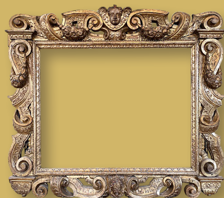
Sansovino Rahmen, Privatsammlung M. Schöni, Zürich

Der Sansovino Rahmen und dessen Bezeichnung leitet sich ab vom italienischen Architekten und Bildhauer der Renaissance namens Jacopo Sansovino. Dieser in Venetien, aber auch in der Toskana Ende des 16 Jhs. verbreitete Rahmentypus erkennt man gut an seinen symmetrischen Ornamenten aus der Architektur wie Voluten, Rollwerke, Kartuschen, und Agraffen. Diese wurden mit Halbfiguren, Fabelwesen und grotesken Masken kombiniert. Die Gesamtform ist ähnlich wie die Gebäude im florentinischen Bereich.